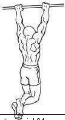
Figura 2 – Posição inicial 01 e, posição final 03.

b.2 Número de repetições: conforme tabela "Anexo IV".