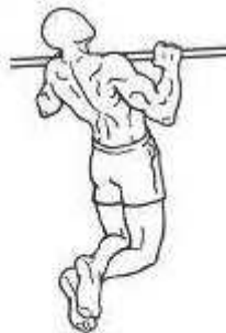
Figura 3 – Posição 02 intermediária.